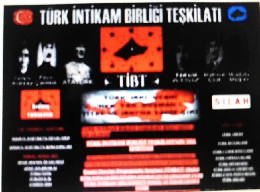
"Türk intikam Taşkilati'na Operasyon"